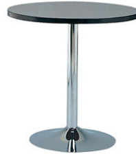
T 59 Z