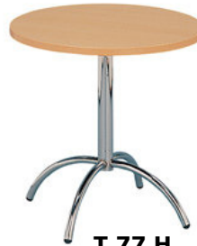
T 77 H