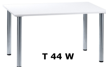
T 44 W