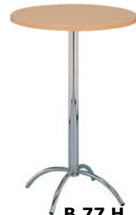
B 77 H