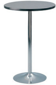
B 59 Z