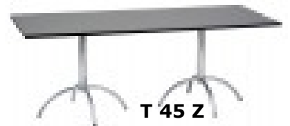
T 45 Z