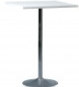
B 59 VKW