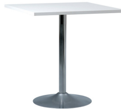
T 59 VKW